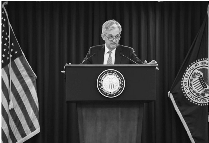
联储会主席鲍威尔

联储会16日发布经济预测和政策声明，预计到2023年底将实现两次加息，利率将从0.1%升至0.6%。同时大幅上调今年通货膨胀率增长预期至3.4%。