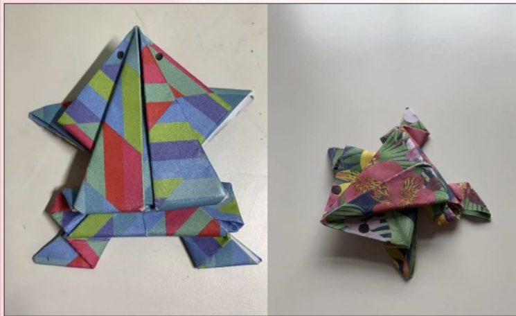
折纸课上同学们折的《小青蛙》

时间过得真快啊,眨眼间我们美中夏令营第一期已经踏进第三周了!七月四日独立日长假期无阻我们的学习兴趣,小编带着节日的喜悦继续走进不同的课堂,把最真实课堂面貌展示给大家。这期,我们将集中报道夏令营文化艺术课程,感受不同的艺术形式如何充实我们孩子的暑假生活!