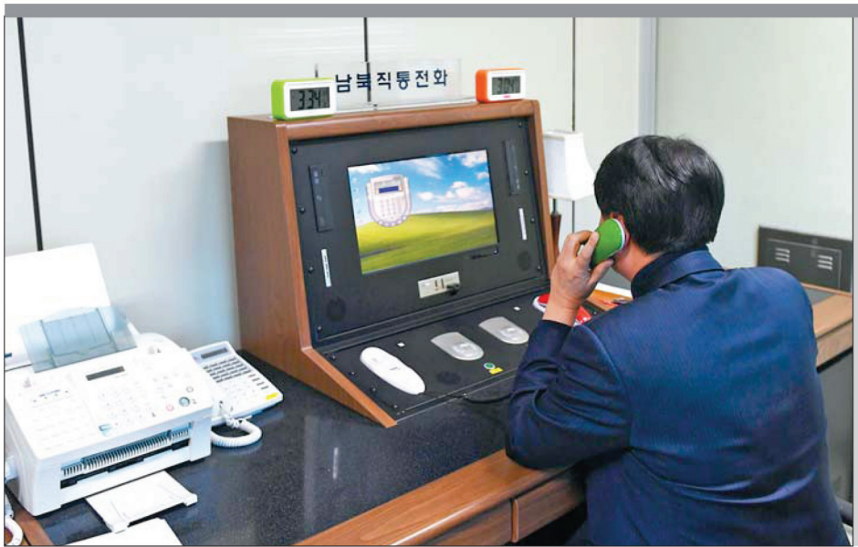
2018年1月3日,在朝鲜半岛中部的板门店,韩方工作人员通过朝韩联络热线与朝方联系。