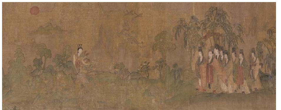
洛神赋图卷 顾恺之(宋摹) 绢本 设色 27.1 X 572.8 厘米 北京故宫博物院藏

元初赵孟頫的《秀石疏林图》把笔墨技法意境创造,诗书画结合的文人画审美观念付于实践。元四家(黄公望,王蒙,倪瓚和吴镇)均师法董巨,又各具特色,把文人画推到了高峰。也是山水画的一个重要转折点。不再强调山水的内在结构与韵律,而是作为移情寄兴的手段,表现画家的自我人格与个性。对后世的绘画,尤其是“南宗”一派影响巨大。