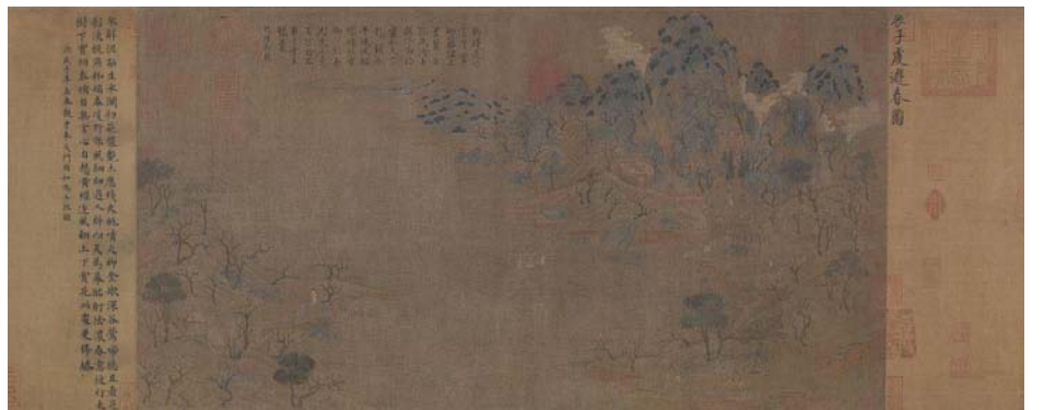
《游春图卷》唐展子虔 现存最早的山水畫 隋,展子虔作,絹本,設色,43 X 80.5 厘米 北京故宫博物院藏