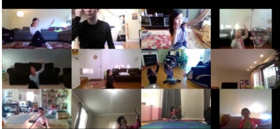
《梁红舞蹈课》里,孩子在复习舞步的情况