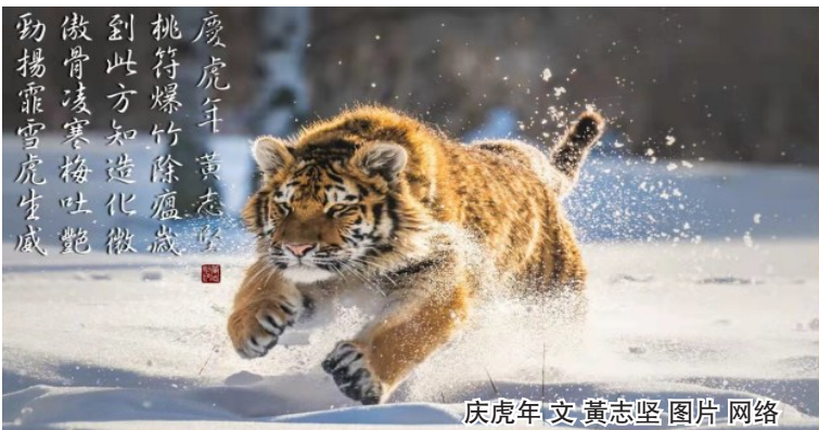
庆虎年 文 黄志坚 图片 网络