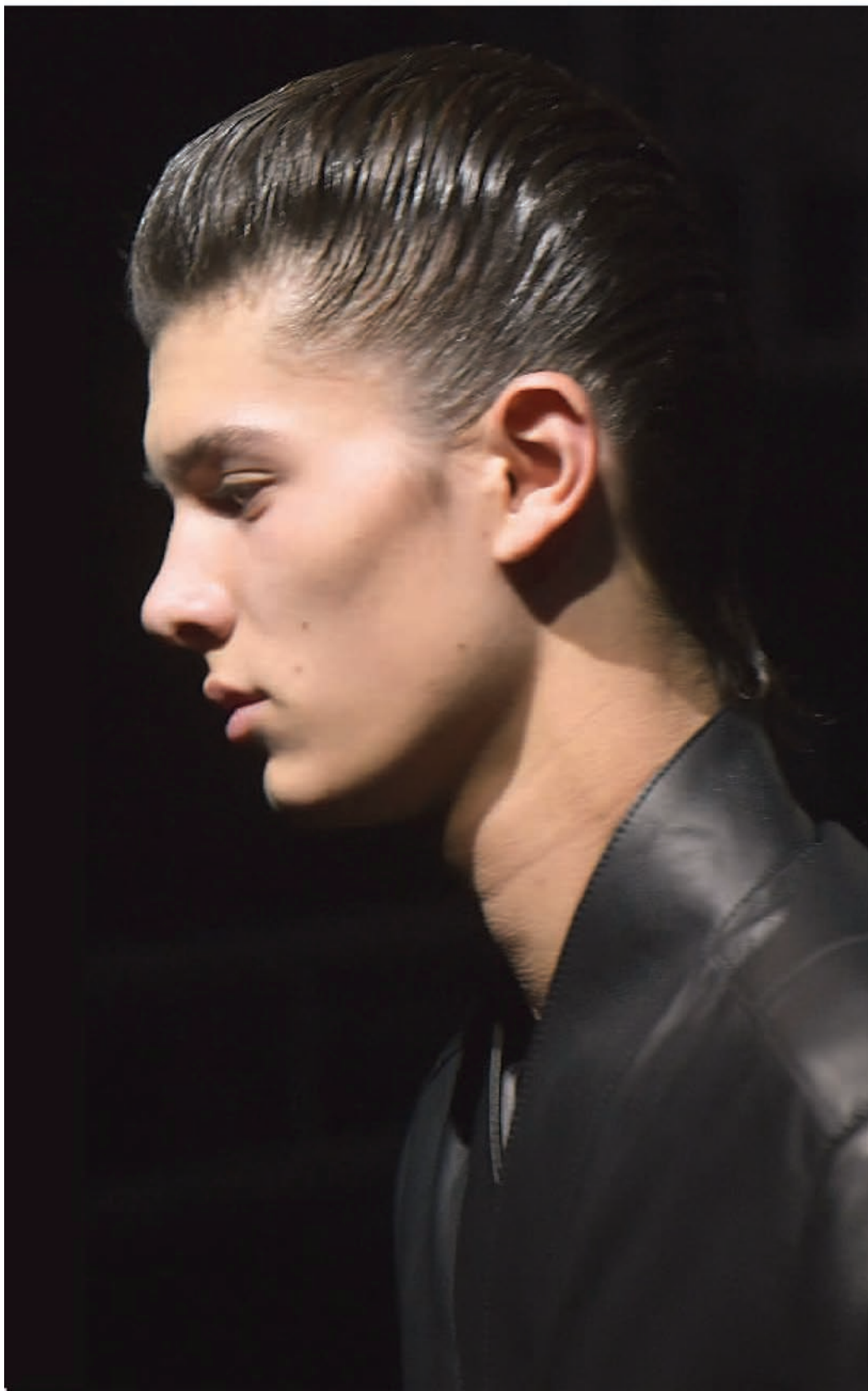
丹麦尼古拉王子 2018年2月开始走秀,图为他登上 Dior 秀场。