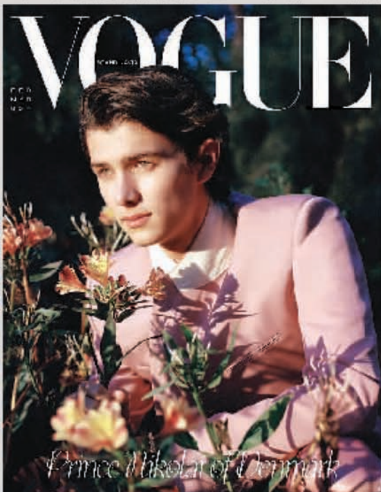
他登上Vogue斯堪的纳维亚版2022年二三月刊封面。