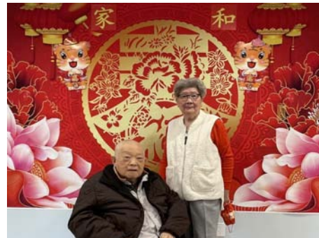
享受日托医护养服务 申请和等待全托福利