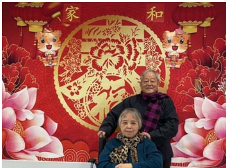
享受日托医护养服务 申请和等待全托福利