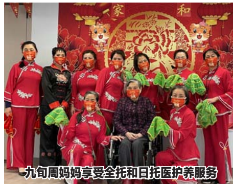
九旬周妈妈享受全托和日托医护养服务