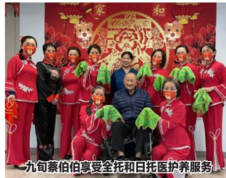
九旬蔡伯伯享受全托和日托医护养服务