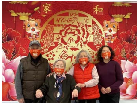
享受日托医护养服务 申请和等待全托福利