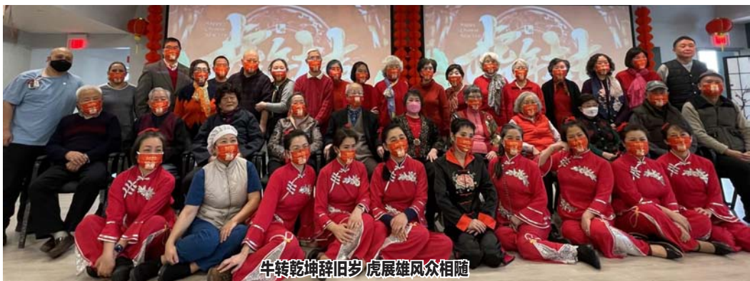
牛转乾坤辞旧岁 虎展雄风众相随