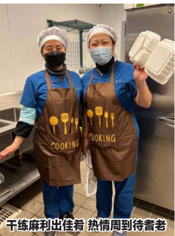
干练麻利出佳肴 热情周到待耆老