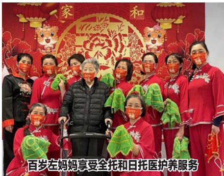
百岁左妈妈享受全托和日托医护养服务