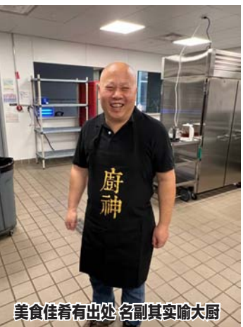
美食佳肴有出处 名副其实喻大厨