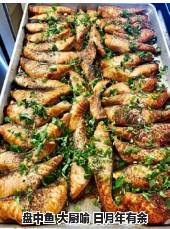
盘中鱼大厨喻,日月年有余