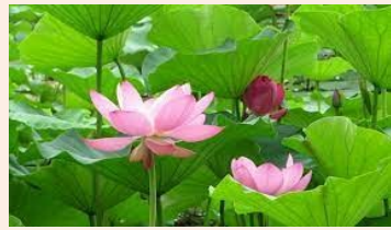
都有点荷花的味道。荷花长得很漂亮,花蕊有黄色和粉色,外面都是深浅粉红色或白色。我觉得荷花是花中最美的。而它出自淤泥而不染的特点,又是最令人敬佩。

还记得我小时候,跟我爸爸在前院种玫瑰花。虽然天热,蹲在地上铲土很累,但看到爸爸种下的玫瑰花我很开心。以后,我每周都去观察我们种的花。我坐在草地上,看它们慢慢地长高,看它们的花瓣慢慢地绽开,心里很快乐。