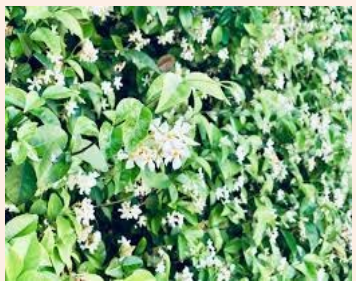
闻是我们的五种感官之一。世界上有超过一兆种味道,每种都非常独特,只选一种我喜欢的