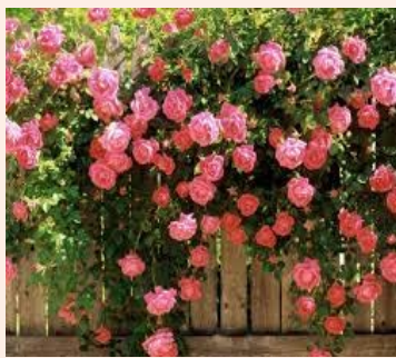
春天最美丽的就是花。鲜艳的花朵把我住的小区打扮得五颜六色。