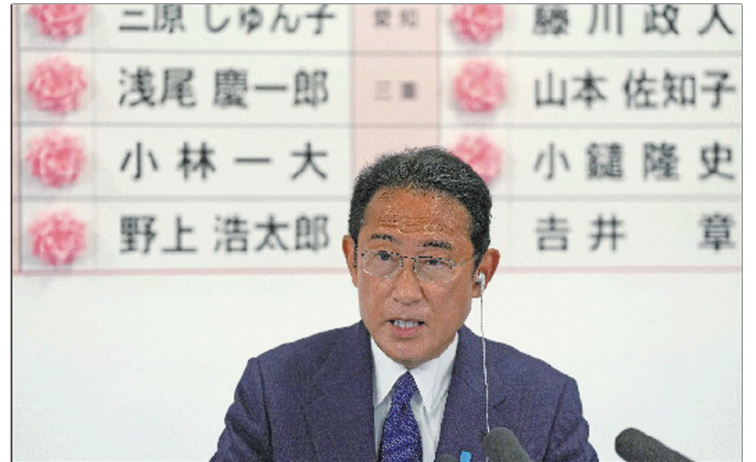
10日，在自民党总部，岸田文雄为当选议员贴花后发表讲话。

10日晚间，岸田文雄曾表示，修宪“是非常紧迫的课题”，“今后将在国会中加强关于宪法的讨论，并提出更加具体的议案”。而公明党党首山口那津男前一天明确表