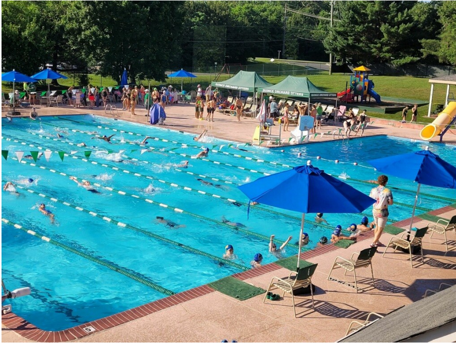
(QO Otters 泳队继续训练中)

中心陆续改进或新增设备以方便客户。虽然美京华人活动中心 CCACC 收购 Quince Orchard 游泳网球俱乐部仅仅一个月时间,但我们的设备和服务已经得到了很多改进。尽管并非所有的改进是大改动,但是,它们都对我们服务客户的基础和便利设施非常有益。