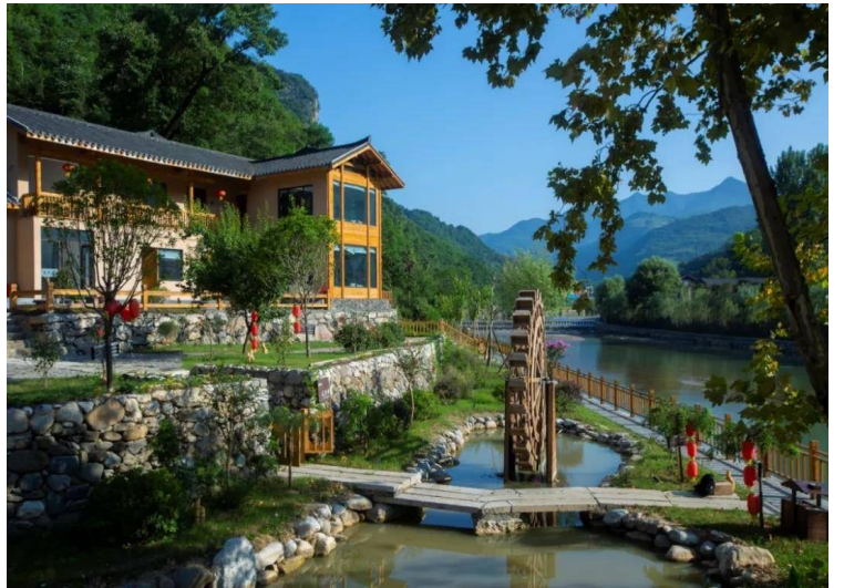
关防驿(乡宿培训基地)

东篱下,悠然见南山,一方庭院,三五好友,几盏清茶,人生最快乐的事情也莫过于此吧。从酒店、私董会、豪华小区转向世外桃源,从高消费与快节奏转向慢生活,寻找灵魂与内心的归处,也许沙沟村已经实现了。