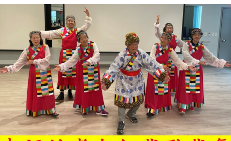
幸福的耆老们载歌载舞荣获全托养老金夫妇