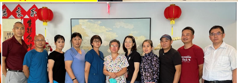
家和医护养中心管理人员