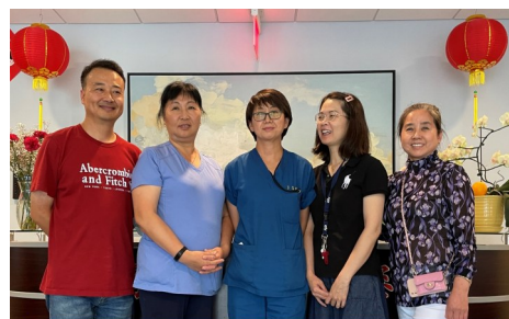
家和医护养中心经理及其助理

里就为耆老申请到了CO福利，极大地安慰和鼓舞了家和医护养中心的老人们，没有了后顾之忧，安心地欢渡晚年。值得一提的是：在马里兰州的低收入人群中，大约二万二千人在排队申请CO福利！