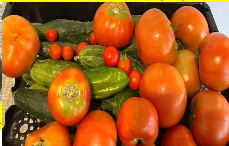
家和医护养中心菜地的丰收