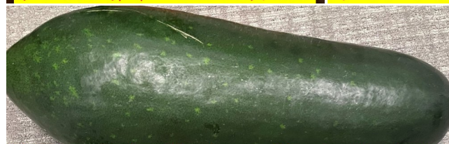
家和医护养中心菜地的丰收