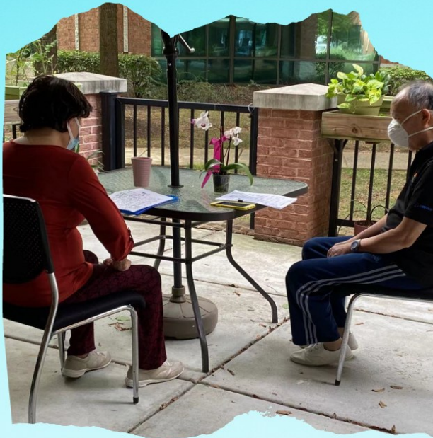
清晨两位耆老在后庭院练练声