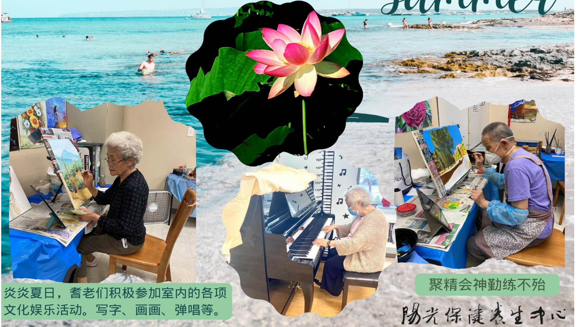
炎炎夏日，耆老们积极参加室内的各项文化娱乐活动。写字、画画、弹唱等。