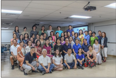
美中实验学校8.20教师培训大会合影