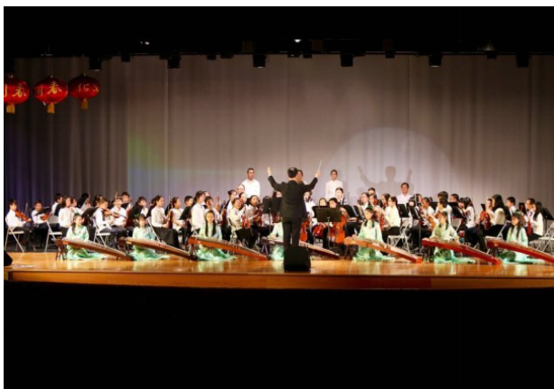
弹古筝的你,是否感到一个人的《高山流水》知音难觅?拉二胡的你,是否觉得一个人的《二泉映月》如此寂寞?