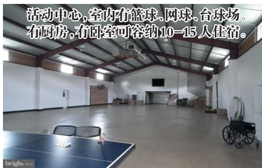
活动中心,室内有篮球、网球、台球场。有厨房,有卧室可容纳10-15人住宿。

最为推荐的是距离农场5-10分钟,有3处仙纳度国家公园登山口,其中white oak canyon trail 爬山,风景很美,hiking 30-40分钟左右单程可见瀑布,全程都有树荫。