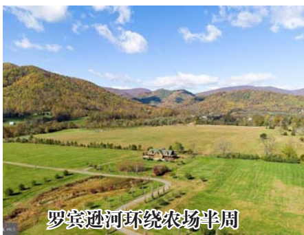
罗宾逊河环绕农场半周