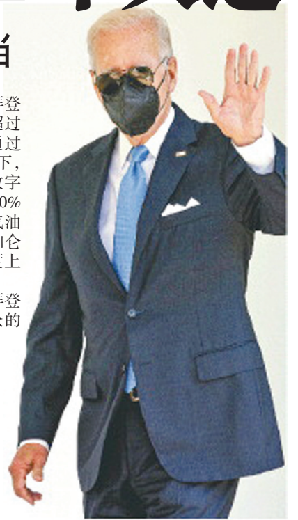
美国总统拜登在华盛顿白宫玫瑰园出席活动(资料照片)。

美国全国广播公司新闻台当地时间18日公布的民意调查结果显示,就希望民主党还是共和党赢得国会改选即中期选举,继而掌控国会参众两院,两党的支持率旗鼓相当。