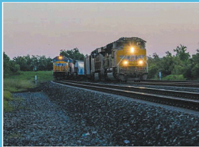
美国铁路货运列车(资料片)

最后关头,拜登政府以一项条件丰厚的加薪协议,让美国30年来最大规模的铁路大罢工按下“暂停键”。但高通胀让美国人越来越敏感,更多危机正在路上,美国恐怕很难消停。