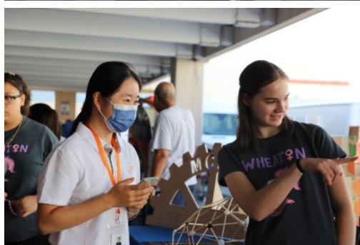
▲我们的一位记者采访了总部设在Wheaton高中的女性工程师协会的一名成员。她指着一辆低矮,光滑,画着火焰的汽车说,这是她们协会去年设计的,“对我们来说,这是我们女性工程师从燃油车转向电动车的一个倡议。”