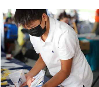
▲一名JRC小记者兼志愿者在CAPA的展台前工作。