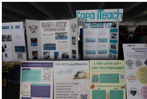
▲蒙郡华裔家长联合会的台位上贴满海报,华裔家长联合会举办了许多活动,如Growing and Giving俱乐部,iTeach俱乐部等。