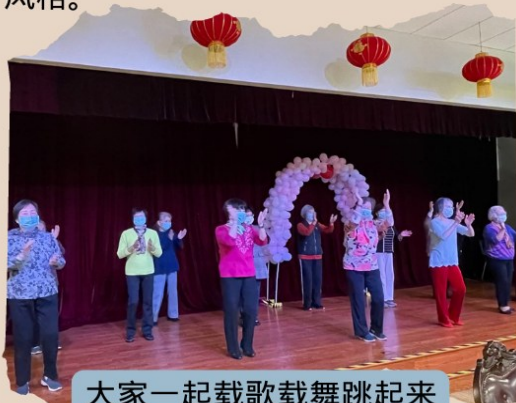
大家一起载歌载舞跳起来