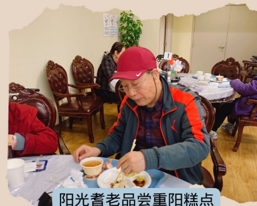
阳光耆老品尝重阳糕点

可口的美食给耆老们带来温暖和喜悦，也带来浓浓的节日气氛；活动部组织员工们在活动大厅和耆老们一起，以快闪的形式载歌载舞，大家唱起歌来、跳起舞来、一起欢乐起来！中华民族的传统文化，在阳光得以发扬和延续，使得华夏儿女在异国他乡也同样能感受到一份浓浓的中华情。祝愿大家，重阳节快乐！