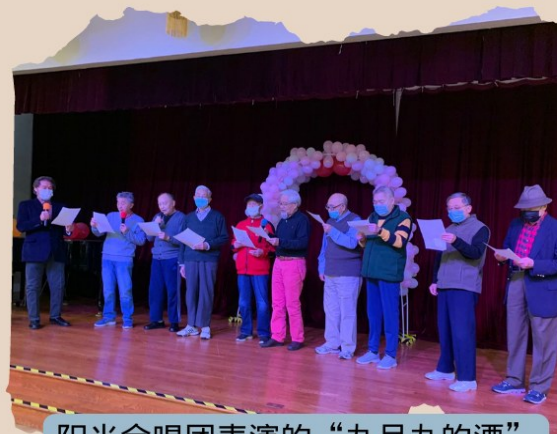
阳光合唱团表演的“九月九的酒”