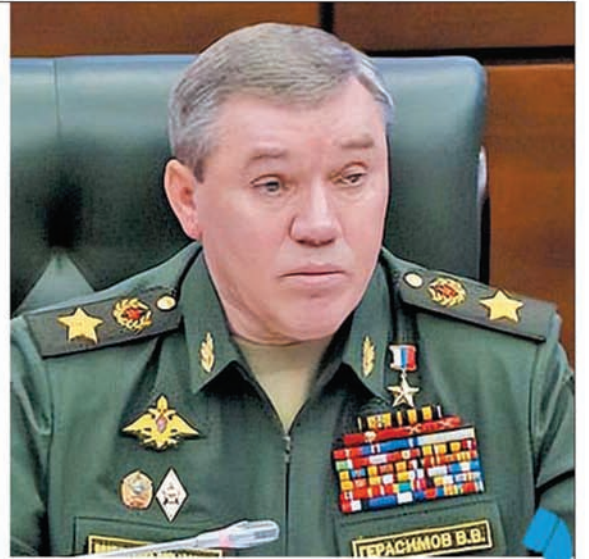
▲俄武装力量总参谋长格拉西莫夫 ▼美军参谋长联席会议主席米利