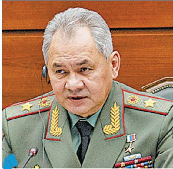
▲俄罗斯国防部长绍伊古 ▼美国国防部长奥斯汀