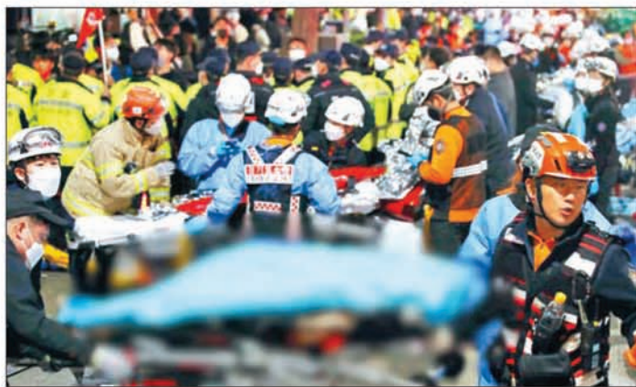
10月30日凌晨，救护人员在踩踏事故现场进行救援工作。

常大规模的灾难发生时才会下达应对第三阶段命令。韩国消防厅表示，为处理事故共派出500多名消防员和1100多名警察。但由于现场道路狭窄且人流密集，急救人员接警后40分钟才抵达事发现场。当晚，消防部门调遣首尔本地和周边地区140余辆救援车前往事发现场救援，韩国保健福祉部向现场派出15支救援队。