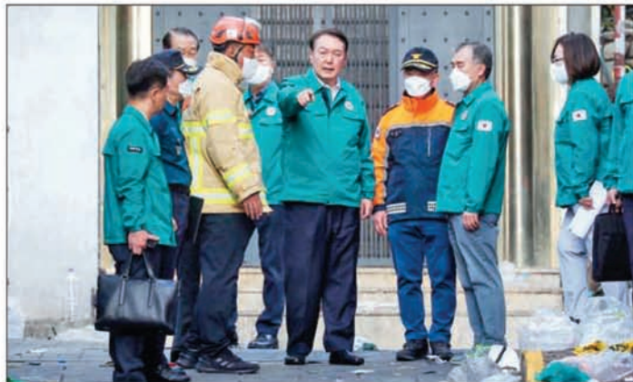
10月30日，韩国总统尹锡悦(中)在踩踏事故现场了解情况。