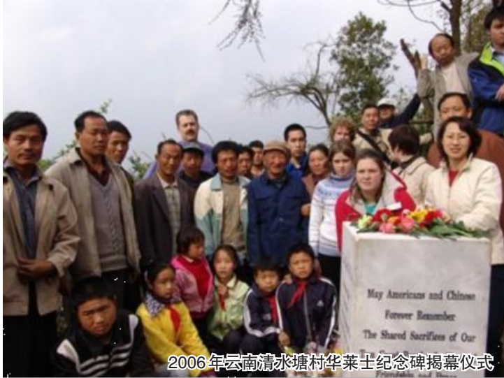
2006年云南清水塘村华莱士纪念碑揭幕仪式