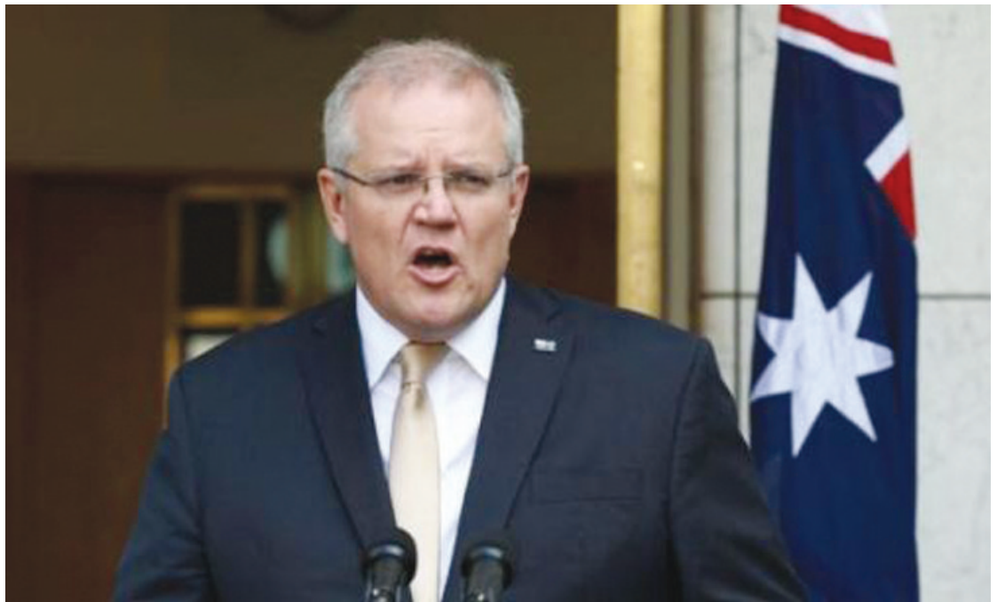
时任总理的莫里森在国会大厦出席新闻发布会。

按照澳大利亚法律专家的说法，莫里森秘密自封官职的做法有法律依据。不过，前高等法院法官弗吉尼亚·贝尔主持的一项调查于上周公布结果，称莫里森暗自封官的做法导致公众“对政府的信任受损”，建议修补相关法律漏洞。