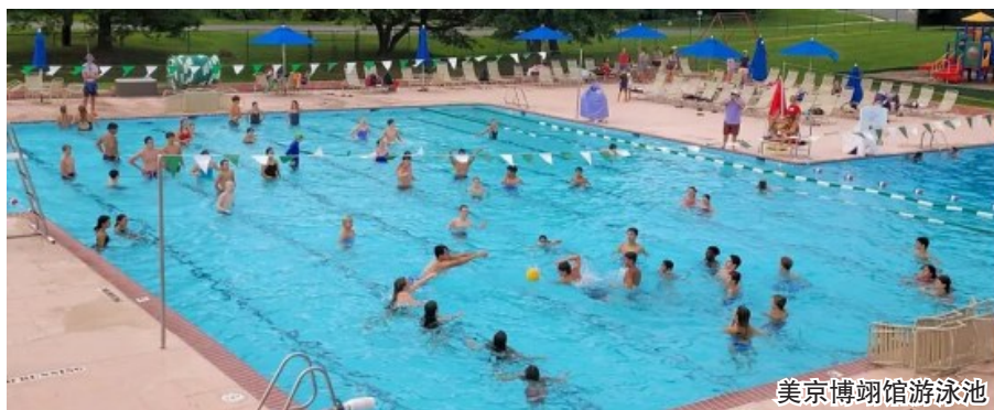
美京博翔馆游泳池

美京华人活动中心CCACC的董事们与各部门的主管们,日前在博翔馆(游泳网球中心)的前草坪齐聚,见证种植象征坚毅不拔的两棵松树的历史时刻,这植树活动是庆祝CCACC 40周年的系列之一,寓意CCACC 坚实茁壮的向上发展。初为中心义工的我,当时现场采访时,深深佩服中心元老、董事、主管、员工和许多义工们的无私奉献与努力不懈,故特撰文叙述见闻。