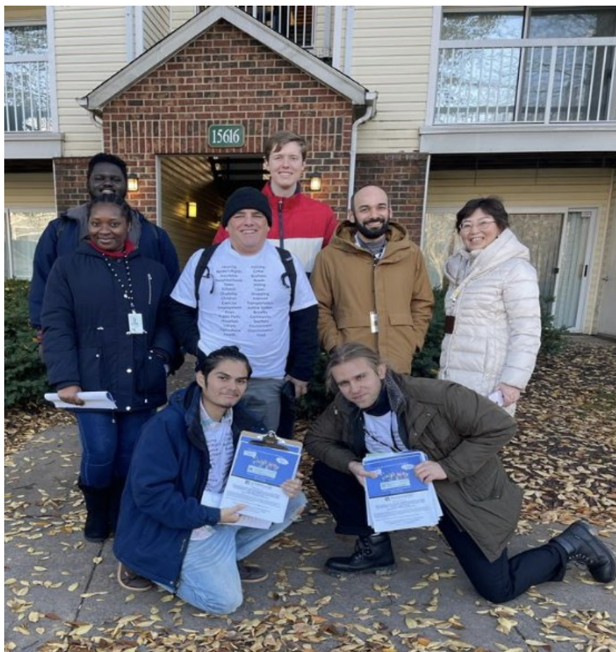
多语种走访小组成员合影

创办于1982年的CCACC是大华府地区最大的非营利性社区服务组织之一。扎根蒙郡,CCACC一直为亚裔社区提供多元化服务,服务部门包括欢乐日间保健中心、居家护理中心、健康医疗中心、美京艺廊、博雅苑(教育中心)、社区服务中心、博翔馆(Quince Orchard 游泳网球中心)。CCACC 期待您的加入!