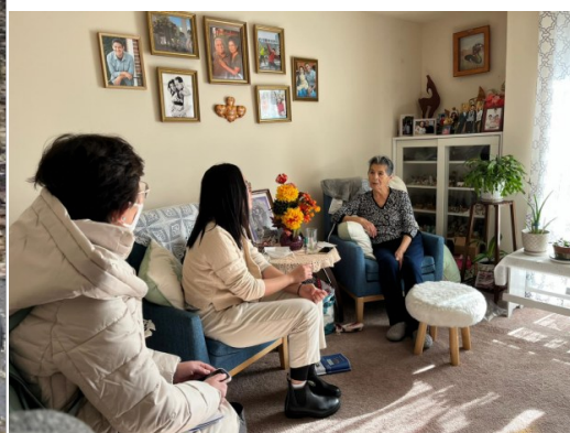
盖城 Londonderry Towers 公寓楼的一位居民(右一)邀请走访小组进家门,讨论如何改进社区。