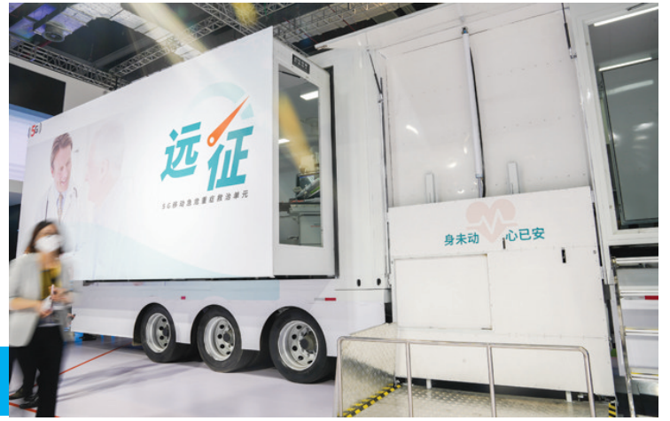
图为11月6日在第五届进博会医疗器械及医药保健展区西门子展台拍摄的“远征”5G移动急重症救治单元。

报告称,中国无线治理能力迈上新台阶,持续出台移动通信、短距离通信、物联网、卫星等领域政策;无线电管理方面,加强了顶层设计;协调保障了5G移动通信、工业互联网、车联网、卫星通信和导航等行业用频需求。