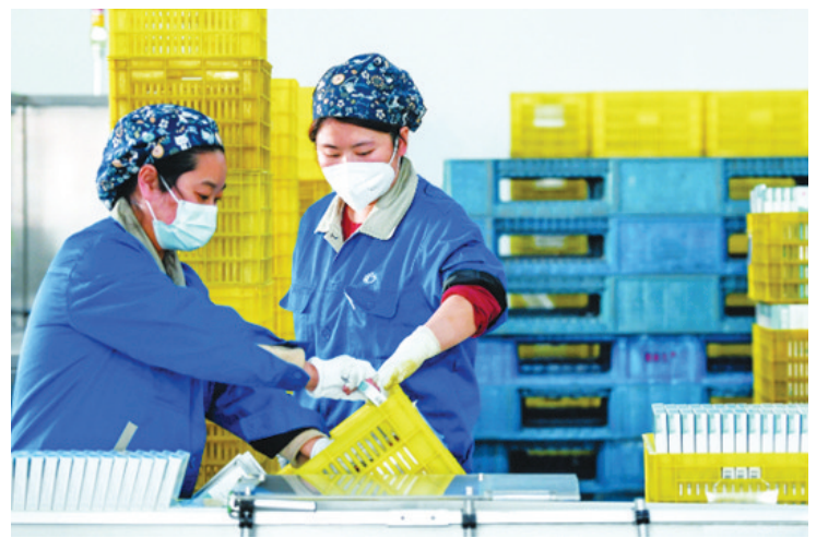
连日来,中国多地药企开足马力加紧生产,加大药品供应。图为2022年12月19日,西安一家药企的工作人员在外包装车间作业。

阿兹夫定是已在中国获批上市的三款抗新冠病毒小分子药物之一,由复星医药与河南真实生物战略合作开发。临床试验证明,该药对新冠病毒有良好的抑制作用,对于病毒变异株同样有效。