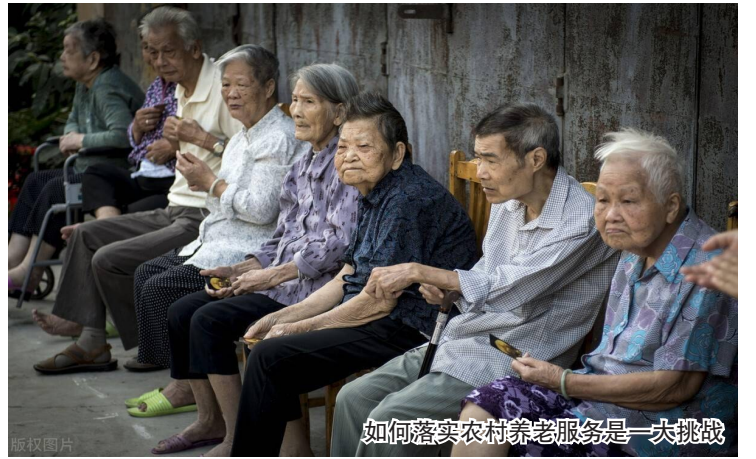
如何落实农村养老服务是一大挑战

国家力量如今很重视农村养老，但一些撒胡椒面式的帮扶，远不如直接提高养老金待遇水平、提高医保报销标准、推行长期护理保险、提供健康义诊等针对性措施有