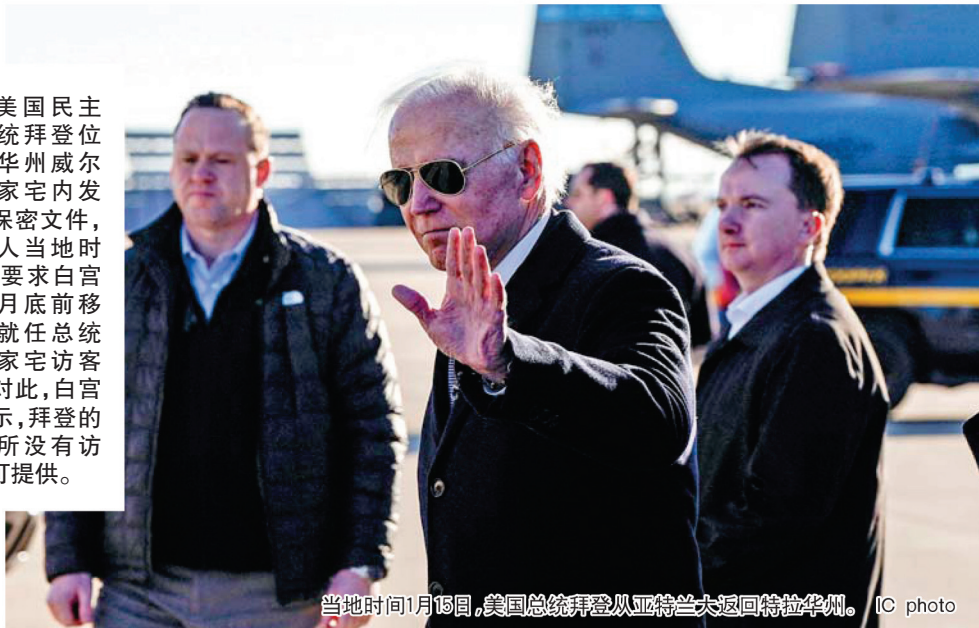
当地时间1月15日，美国总统拜登从亚特兰大返回特拉华州。

分寸感”。 因美国民主党籍总统拜登位于特拉华州威尔明顿的家宅内发现更多保密文件，共和党人当地时间15日要求白宫方面本月底前移交拜登就任总统至今的家宅访客记录。对此，白宫方面表示，拜登的私人住所没有访客记录可提供。