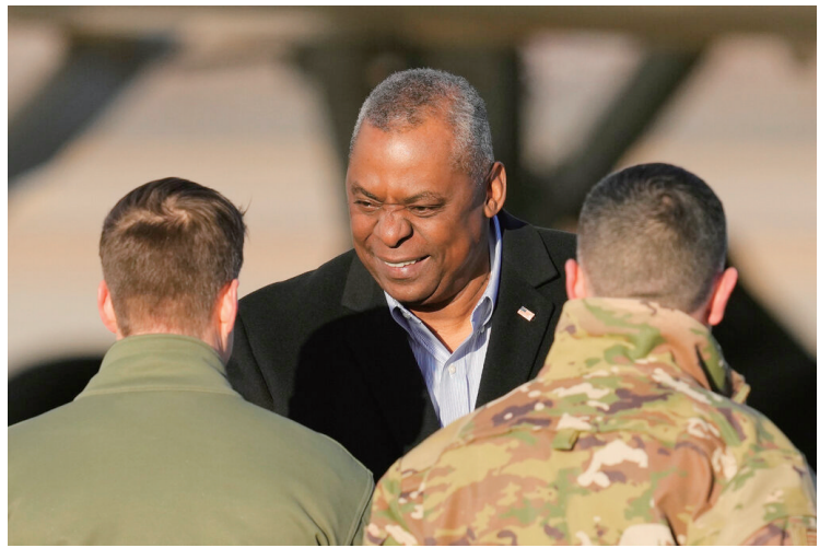
防长奥斯汀于当地时间30日下午抵达韩国。

奥斯汀在文中写道：“我们应保持警惕，朝鲜在过去数十年间研发了核武、弹道导弹及其他武器，去年还空前频繁射弹，这是违反《国际法》及联合国安理会多项决议的极其危险行径。这就是美韩不断扩大联演范围和规模，通过实弹射击训练维持可随时投入战斗的‘今夜就战’(Fight Tonight)态势的理由所在。这也是包括三边反导、反潜联演在内，与日本深化三边合作的理由。美韩日站在一起时，我