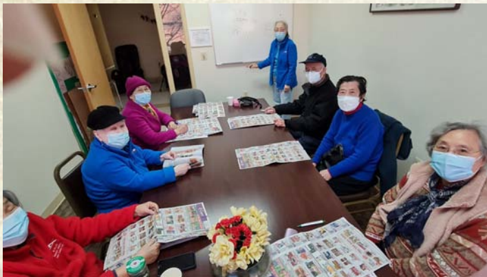
孫老師英語班留影