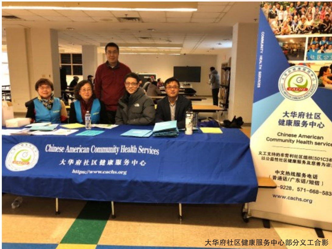
大华府社区健康服务中心部分义工合影

大华府华裔社区健康服务中心(Chinese American Community Health Services)是一个目前主要由义工运作的非营利社区组织(501c3机构), 以致力于慈善及公益性社区健康服务为宗旨。如希望了解更多信息, 以及如何捐款和加入义工, 请登录浏览中心的网站: www.cachs.org 。