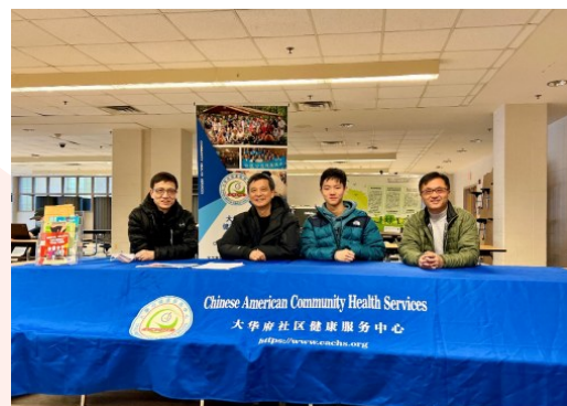
大华府社区健康服务中心部分义工合影