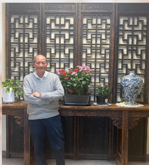
林伯伯在中心前厅留影