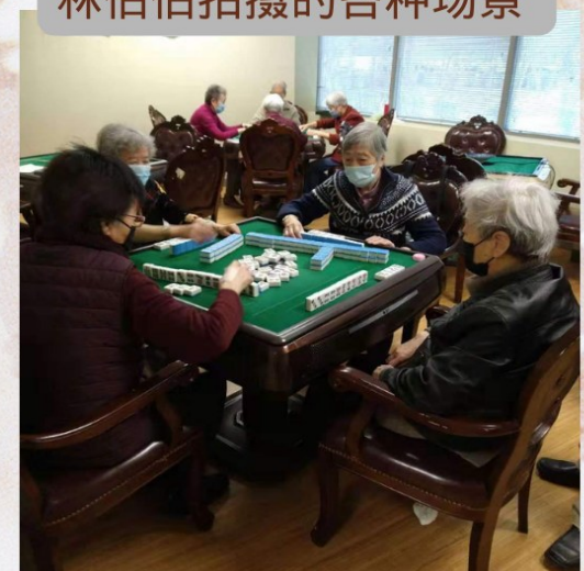
阳光保健养生中心