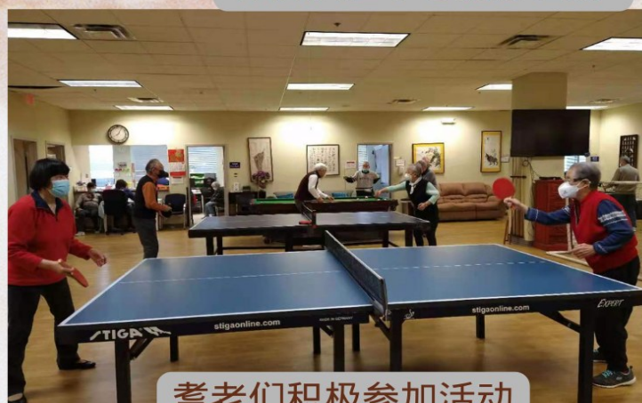
耆老们积极参加活动