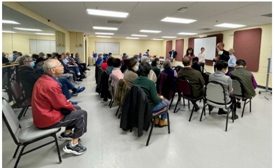
在 Leisure World 中国俱乐部介绍 CCACC 活动里的现场问答。