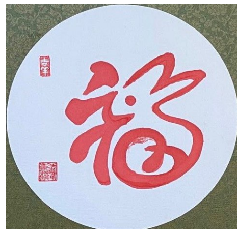
图3 书法 黄秉骥

文艺演出的第三类节目是器乐演奏。先是由Bill用口琴,独奏了近年来非常流行的歌曲《这世界那么多人》。这种口袋中的钢琴虽然体积小,但悠扬的琴声却令人动情。印证了“休言口袋钢琴小,巧口横吹雅乐紫。”诗友社才女陈雯这次展现了她多才多艺的另一面,钢琴独奏《献给爱丽丝》。她的双手轻巧而娴熟地敲击着黑白琴键,如同“十指翻飞编昼夜”,将绵绵的“纯情系向爱丽丝”。听众的思绪随着音符而跳动,陶醉在音乐的海洋。一直活跃于华府著名的天涯乐队,这次派出了由键盘手陆宇、中音萨克斯风手萧红、和次中音萨克斯风手朱杰组成的迷你小乐队为联欢会压轴。乐队演奏了两首经典的世界名曲,《Besame mucho 深深的吻》和《Top of the world 世界之巅》。乐队虽小,能量颇大。其现场表演的效果让气氛顿时热烈起来,生生将联欢会推