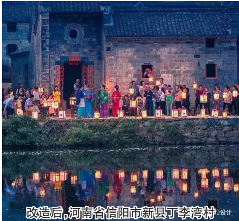
改造后,河南省信阳市新县丁李湾村