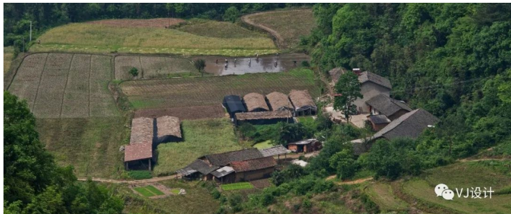
湖北省宜昌市远安县,《山楂树之恋》取景地