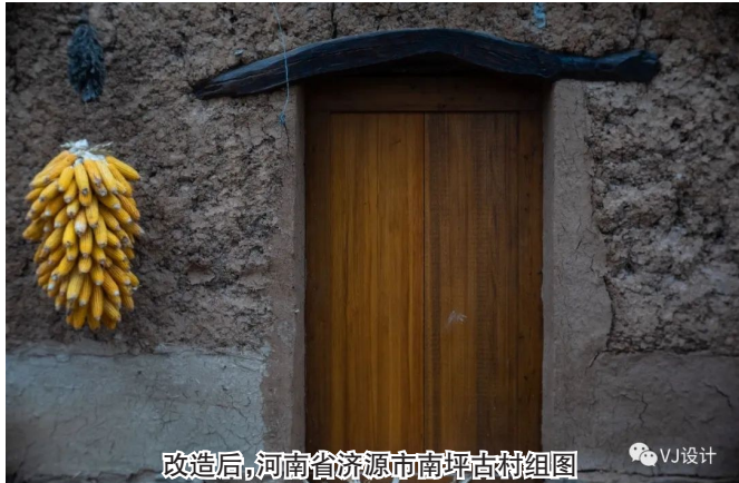
改造后,河南省济源市南坪古村组图