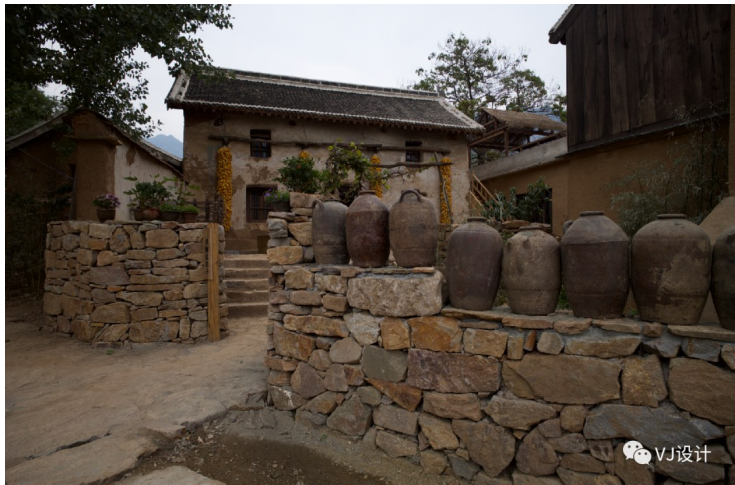
改造后,河南省济源市南坪古村组图