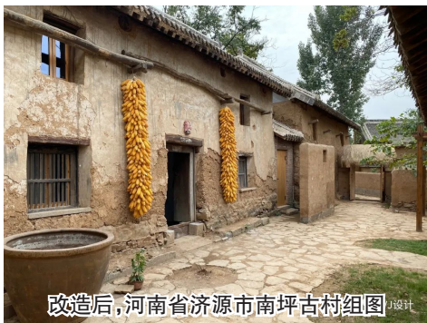
改造后,河南省济源市南坪古村组图