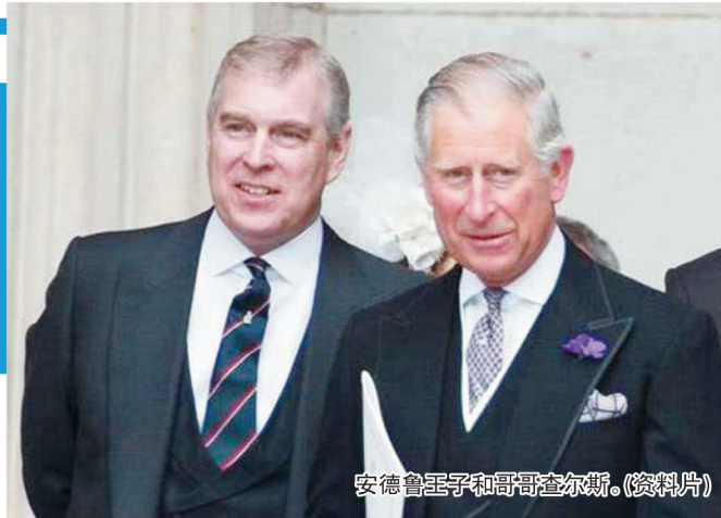
安德鲁王子和哥哥查尔斯。(资料片)

据英国《每日邮报》《太阳报》等媒体报道，英国王室安德鲁王子也要仿效侄子哈里，准备写一本“爆炸性自传”，来证明自己的“清白”，修复受损的声誉。而且，书的名字也已经想好了，就叫《备胎2.0》。