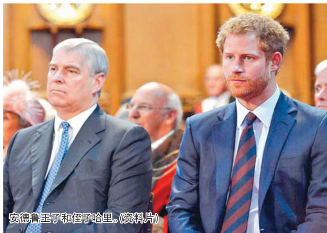
安德鲁王子和侄子哈里。(资料片)

据英国《每日邮报》《太阳报》等媒体报道，英国王室安德鲁王子也要仿效侄子哈里，准备写一本“爆炸性自传”，来证明自己的“清白”，修复受损的声誉。而且，书的名字也已经想好了，就叫《备胎2.0》。