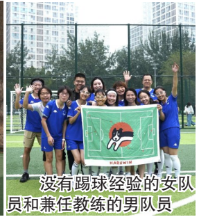
没有踢球经验的女队员和兼任教练的男队员