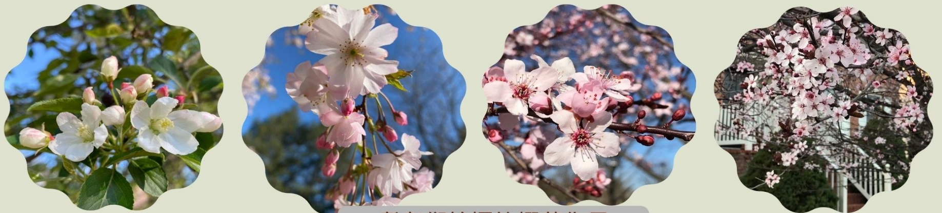
耆老们拍摄的樱花作品

在阳光中心，有这样一批热爱摄影的耆老们，他们善于观察，喜爱大自然，热爱这美好的生活... .. 静物、景致、山川大地，都是他们的参考物；春夏秋冬的四时变换，是他们灵感的源泉；一有空，便拿着相机、手机四处走走，看到可心的画面，他们就拍摄下来，乐此不疲！ 因为喜爱，所以坚持，所以也有了一点点的成就和喜悦... ..