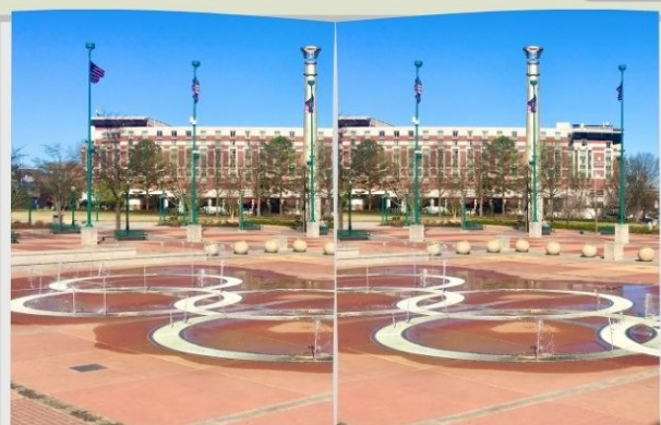
耆老镜头里的亚特兰大