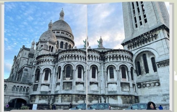
耆老镜头里的法国巴黎