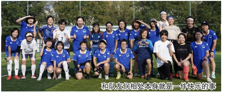
和队友们相处本身就是一件快乐的事

如果说某些文化和社会结构性因素导致女性更容易苛责自己,在 cham 看来,女性之间才更加需要相互支持。输或者赢,都不是一支球队的结局。更让她们在意的是,在一场比赛中是否做到了自己