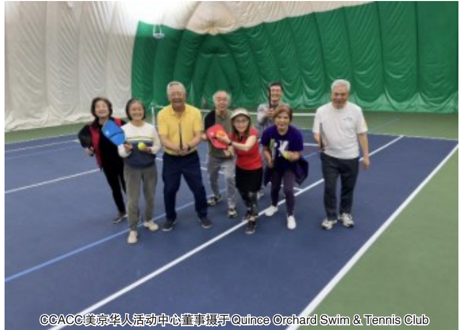
CCACC美京华人活动中心董事摄于Quince Orchard Swim & Tennis Club

CCACC美京博翎馆从2023年4月1日起增加了时下火遍全球的体育运动—Pickleball(匹克球)项目。它是一种起源于美国的新兴运动,结合了网球、乒乓球和羽毛球元素。被誉为年轻人体育社交的新宠,并已被列为2028年奥运会正式比赛项目。这项运动是由三名体育爱好者于1965年在华盛顿州创建,是非常适合家庭和社区的体育活动。