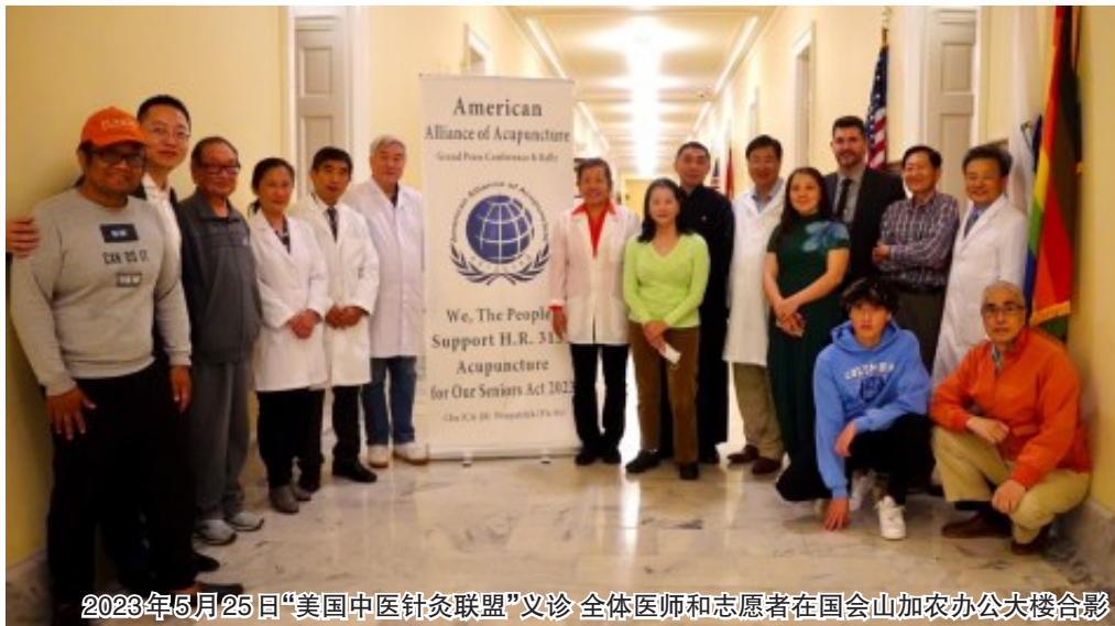
2023年5月25日“美国中医针灸联盟”义诊 全体医师和志愿者在国会山加农办公大楼合影