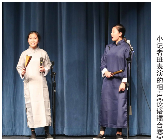
小记者班表演的相声《论语擂台赛》