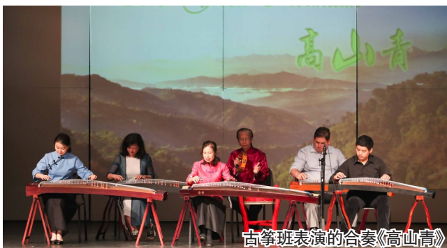
古筝班表演的合奏《高山青》

希望中文学学校泰城校区2023年秋季学期开设了几十门丰富多彩的课程,欢迎大家注册。希望中文学学校泰城校区(Hope Chinese School at Tysons Corner,简称 HCSTC)的地址是:Marshall High School, 7731 Leesburg Pike, Falls Church, VA 22043。注册网址是 https://www.hopechineseschool.org/hcstc 。