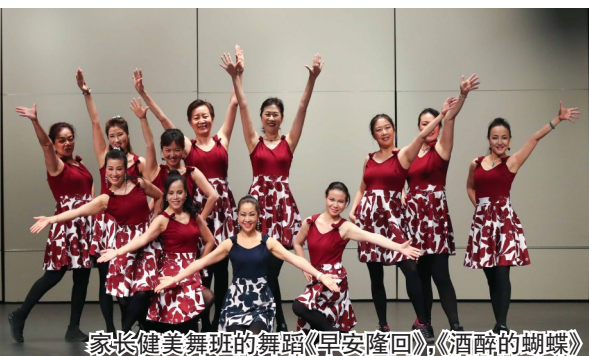
家长健美舞班的舞蹈《早安隆回》、《酒醉的蝴蝶》