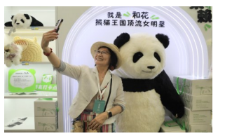
与仿真大熊猫“和花”合影