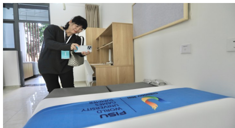
大运村居住区居住区房间