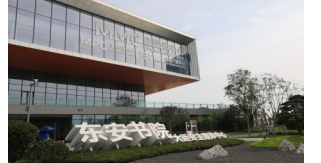
成都大运会主媒体中心