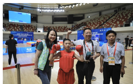
三位海外华媒代表与成都大运会测试赛(武术)参赛选手合影