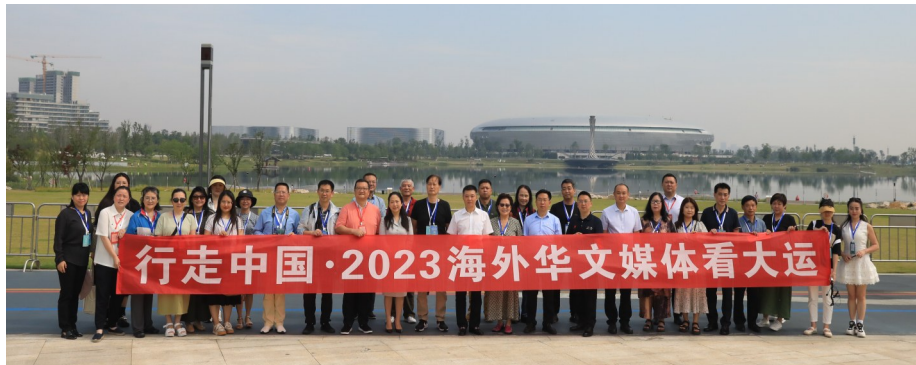
海外华文媒体代表团考察东安湖体育公园

遵循“绿色、节俭、必须”的办赛原则,绿色低碳理念得到贯彻。在东安湖体育公园,场馆集成应用9大项38小项建筑新技术。其中,主体育场首次在西南地区大规模