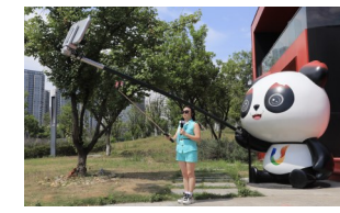
与吉祥物蓉宝合影