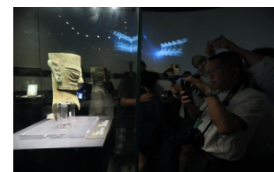
成都博物馆里的三星堆遗址出土的铜人头像