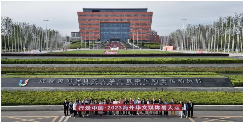
海外华文媒体团考察成都大运村合影