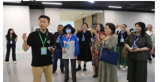
工作人员介绍情况