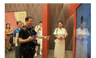
在成都十二月市博物馆里体验AR蜀锦汉服换装