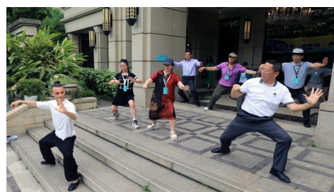
成都武侯区桐梓林社区的一位外籍人士表演陈氏太极拳