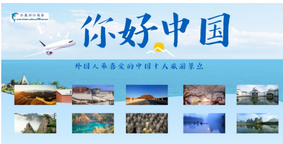
外国人最喜爱的中国十大旅游景点

专业办理中国10年签证! 专业办理中国10年签证! 乐奥专业办理签证,确保您省心省事省钱顺利拿到10年签证。